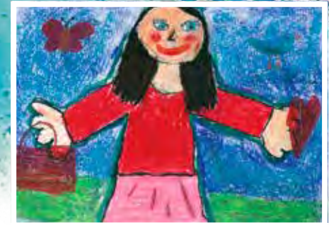
Kati Becher Zyklus 2 Cycle 2