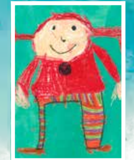
Charlotte Arendt Zyklus 1 Cycle 1

Rétrospective 2016 Imaginaire ou réel, quel héros t'inspire ?