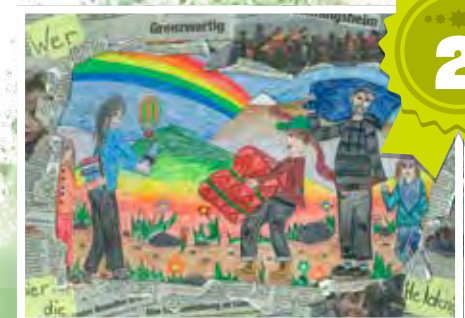
Leni Schneider Zyklus 4 Cycle 4